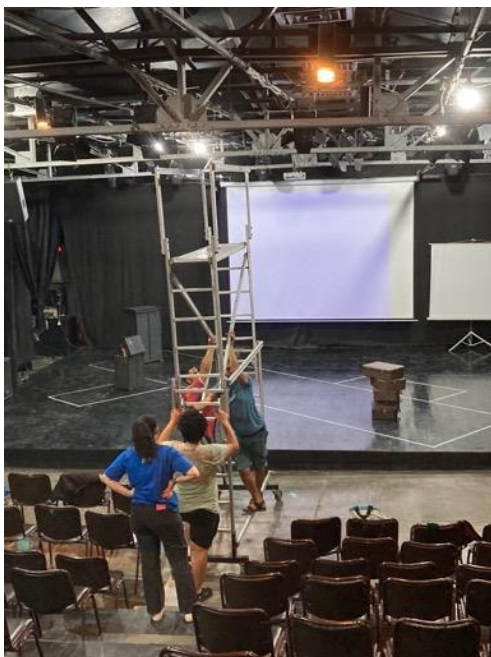
STAGE BUILDING AT JESUITS ALEXANDRIA