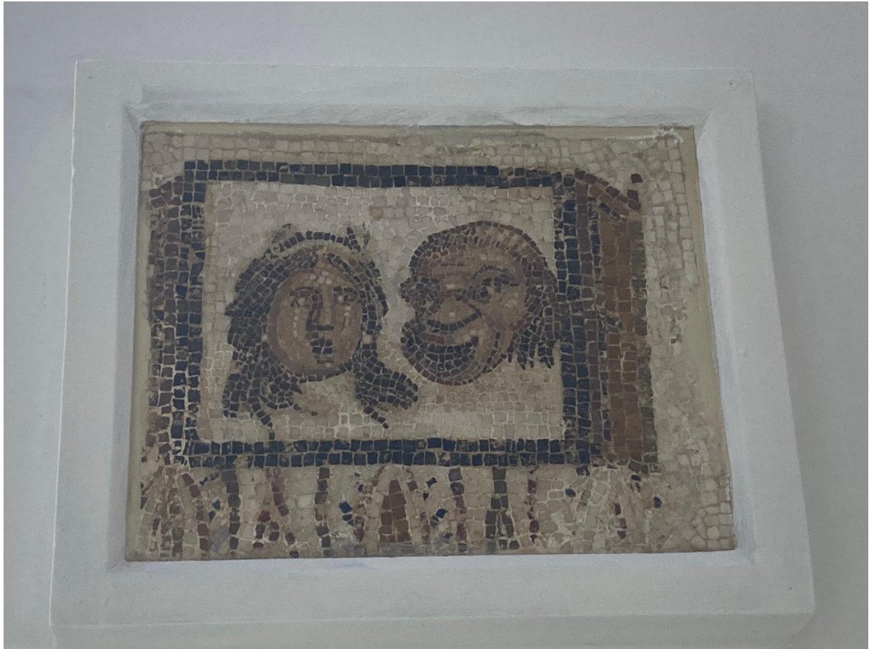
Masques du Musee de Bardo / Tunis

‘Merci pour ce beau spectacle qui lie deux écriture esthétique parallèle l’écriture scénique théâtrale et l’écriture Documentaire historique j’ai été vraiment agréablement surpris . Encore merci pour ce que vous faites. Bonne continuation et j’espère qu’on travaillera ensemble un jour.’