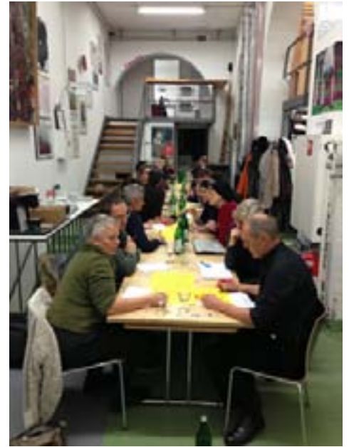
Workshop des Dachverbandes, 30. November 2012, Kunsthalle Bern