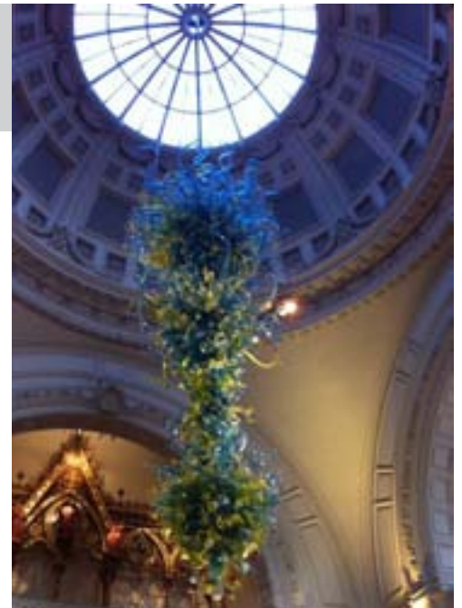
Hall du Victoria & Albert Museum.

Le voyage propose une immersion esthétique, cognitive et interactive dans les différents courants de la médiation, dans une ville qui l'a vue naître et se différencier. Il propose une réponse originale à la question « comment former à la médiation dans toute sa po-